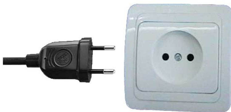
CEE 7/16 zástrčka (eurozástrčka) a starý typ zásuvky C

Tyto zástrčky jdou kromě Velké Británie a Irska použít v celé Evropě.